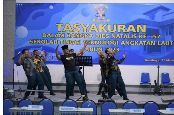
b. Olah Raga dan Kesenian (Orkes)