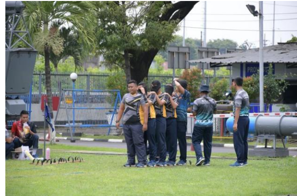
c. SL & LDKS