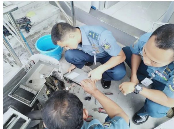
d. Karya Cipta